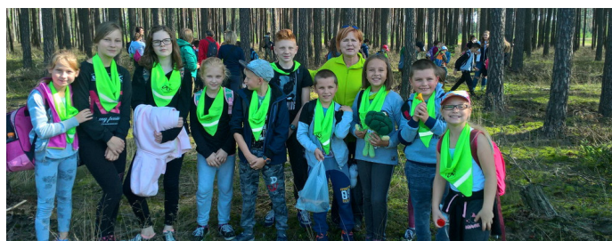
XXVIII rajd pieszych

W dniu 16 września nasza szkoła podstawowa wzięła udział w XXVIII rajdzie pieszym. Rajd rozpoczęliśmy ze SP nr 3, następnie przejechaliśmy pociągiem do Dubielna, następnie pieszo przeszliśmy lasem do Sarnowa, Leśniczówka Mniszek, gdzie ukończyliśmy marsz w Grupie, jednostce wojskowej. Posililiśmy się pyszną zupą i wróciliśmy do Grudziądza pociągiem. Pogoda nam dopisała. Pozdrawiam wszystkich uczestników i już dziś zapraszam a tydzień na rajd Święta Ziemiaka.