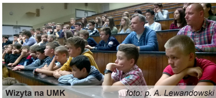
Wizyta na UMK

Z uwagi na unikalny, technicznie zaawansowany poziom pokazów, niemożliwy do przedstawienia poza Instytutem Fizyki UMK, uczniowie mieli okazję uczyć się w zupełnie innych warunkach. Może taki typ zajęć zachęci uczniów do poszerzania swojej wiedzy z dziedziny fizyki, która od tego roku szkolnego wraca do szkół podstawowych.