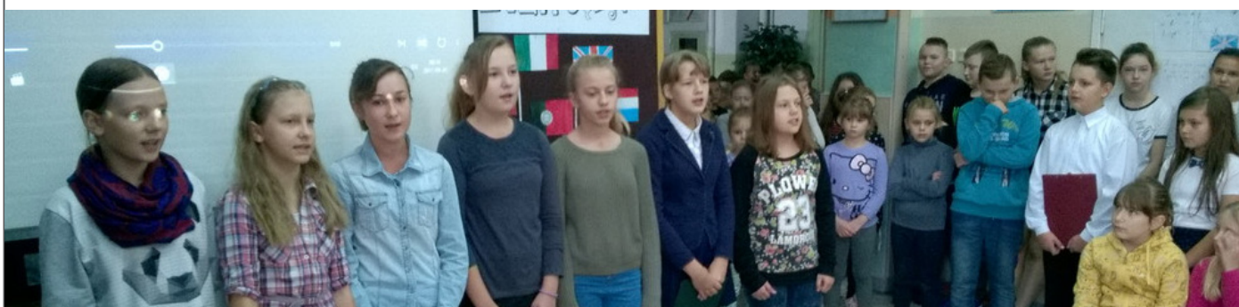
Europejski Dzień Języków Obcych