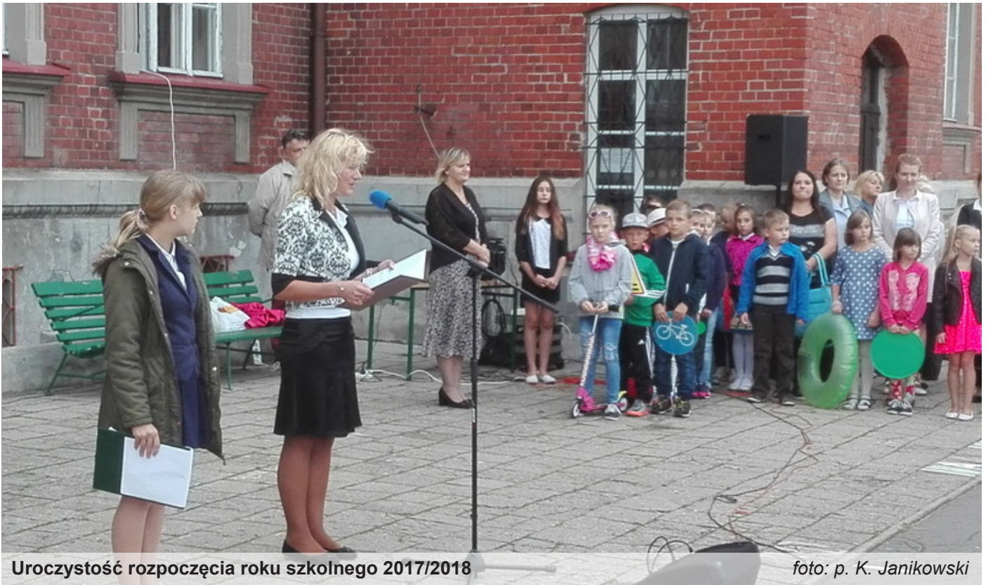
Uroczystość rozpoczęcia roku szkolnego 2017/2018